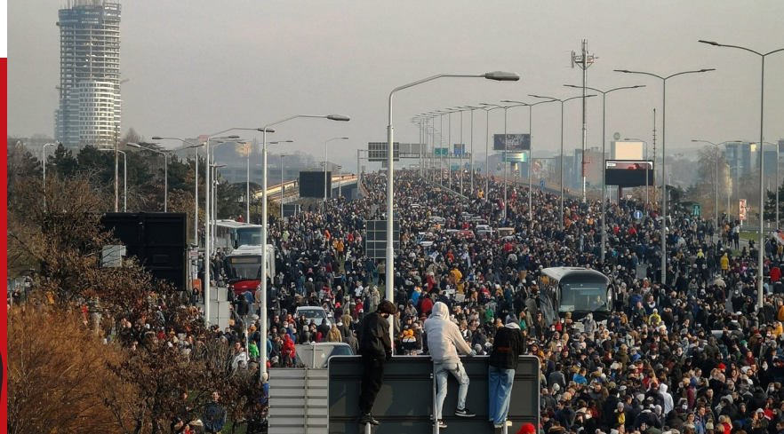
No Rio Tinto Dicembre 2021