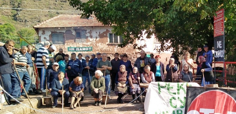
Topli Do- Stara Planina 2019